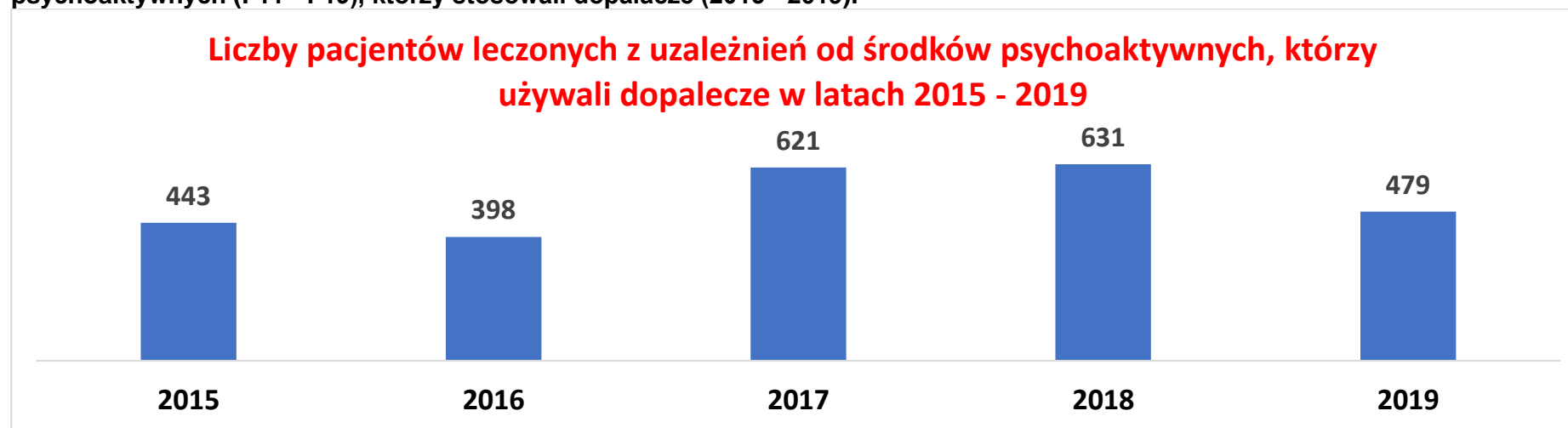
Rysunek nr 2. Liczby pacjentów leczonych w podmiotach leczniczych województwa podkarpackiego z uzależnień od substancji psychoaktywnych (F11 - F19), którzy stosowali dopalacze (2015 - 2019).